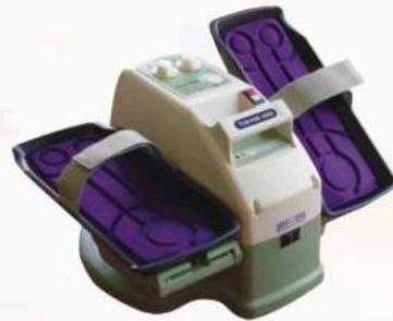
イージ・ウォーク 座りながら歩く運動