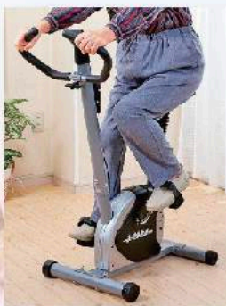
エアロバイク 有酸素運動