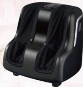
フットマッサージャー