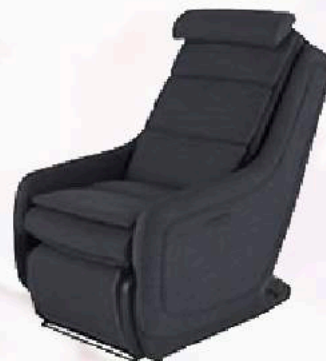
マッサージチェア