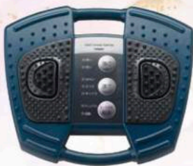
足つぼマッサージ機