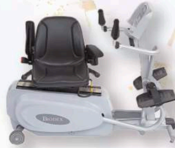
バイオステップ 高性能バイクマシン