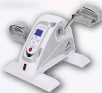
電動サイクルマシン 楽々サイクル運動