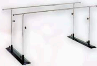
平行棒 スタッフと一緒に 行います