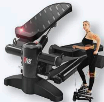
ステッパー 手摺付で安心