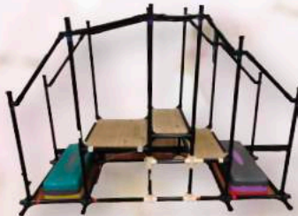
階段昇降 スタッフと一緒に 行います