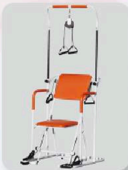
マルチ運動機器 滑車等